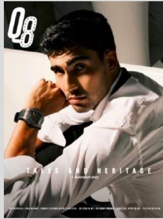
total look, BOSS