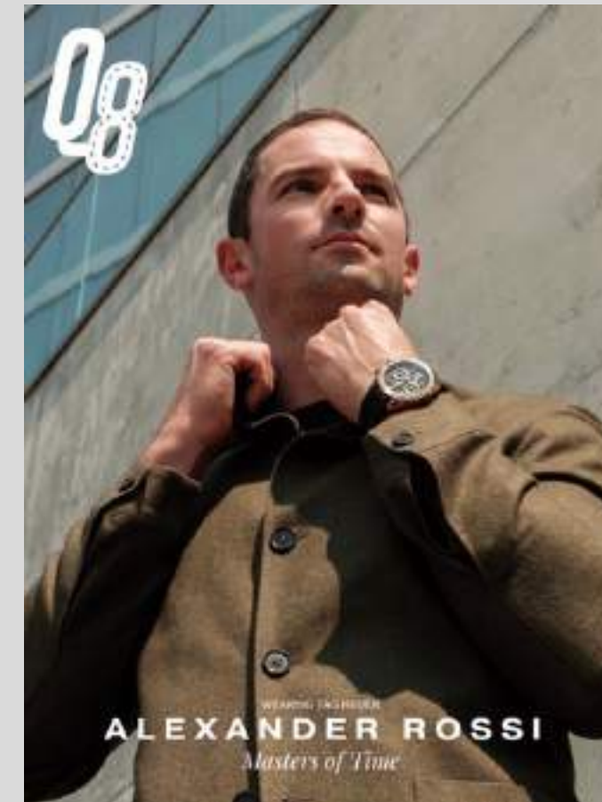
ZEGNA + TAG Heuer