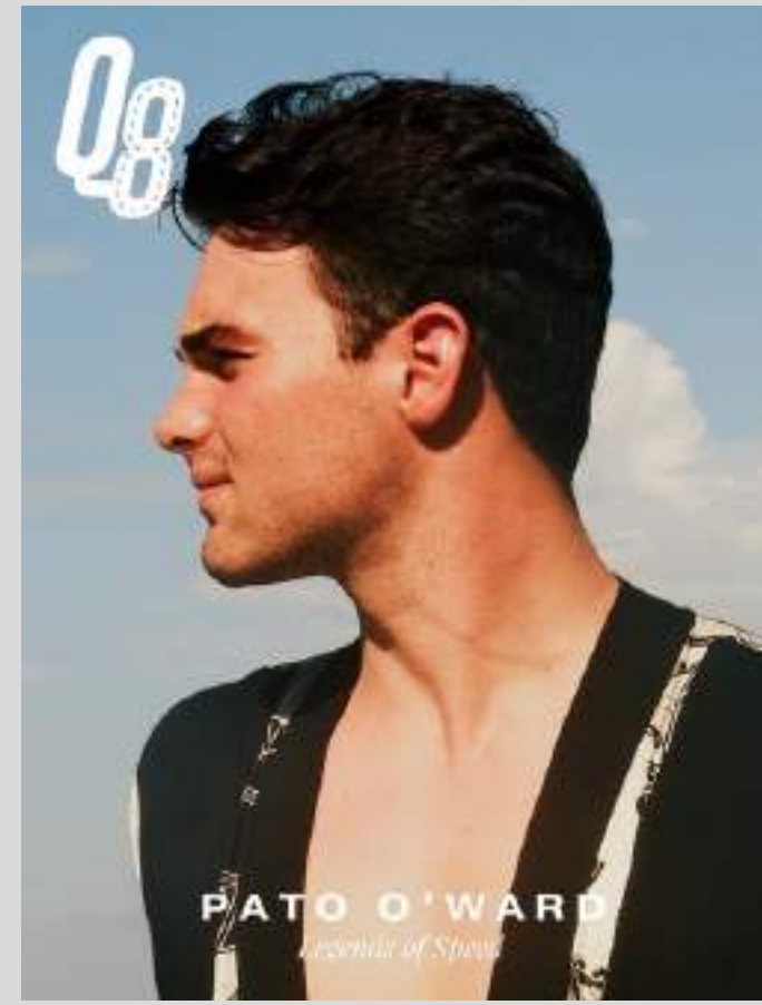
total look, Hermès