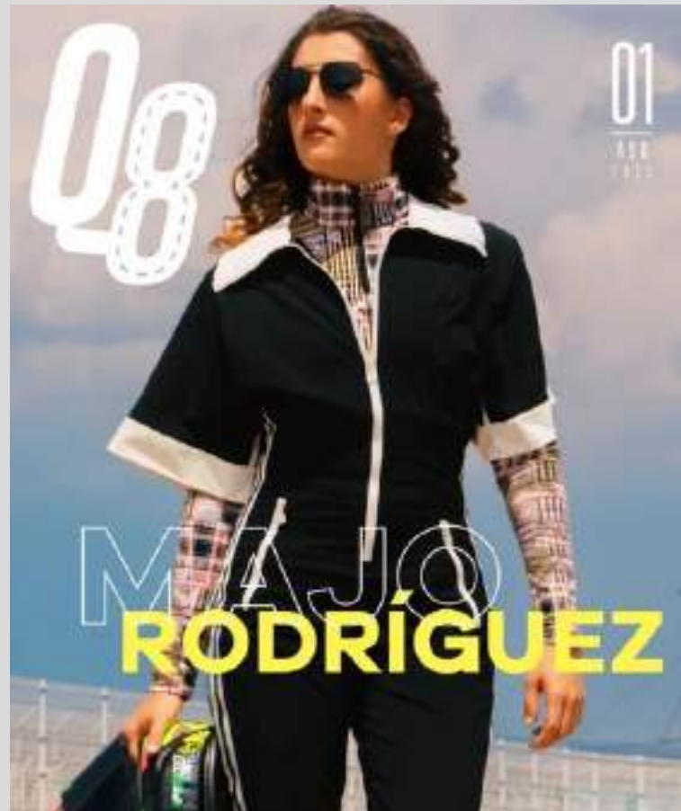
total look, adidas